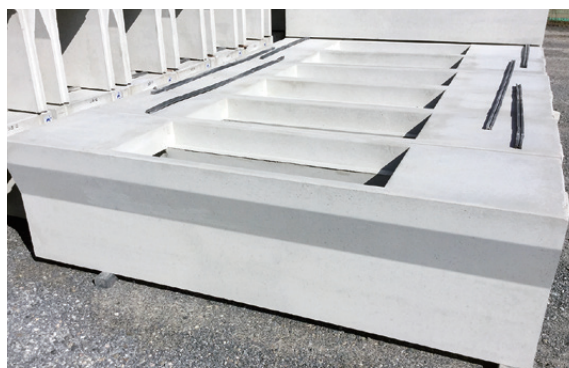
写真2 カルファインダー 90 配合 高流動コンクリート打設製品